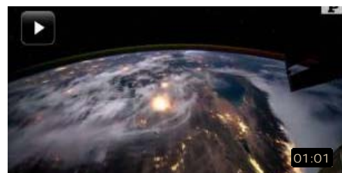
TV Fantastisk video kommer jorden rundt på et minut